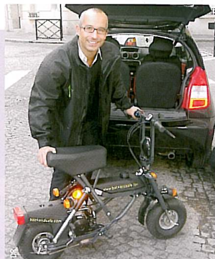
Après avoir raccompagné les invités dans leur véhicule, les chauffeurs rentrent en scooter électriques pliables

Si Back and Safe dispose de plusieurs activités, dont un service voiturier, un service transport des personnes via minibus, monospaces, berlines ou autocars, son originalité réside dans son activité première, le raccompagnement des personnes ayant dépassé le taux d'alcoolémie autorisé. « Nous intervenons dans les 3 à 4 dernières heures de l'événement. Une hôtesse fait souffler tous les invités véhiculés – grosso modo 10 % – dans un éthylotest électronique »; ce qui permet d'en rassurer certains et surtout de repérer les autres, ceux qui sont positifs. Les chauffeurs de Back and Safe prennent alors leur place au volant, après avoir soigneusement glissé un scooter électrique pliable dans le coffre de la voiture... pour leur retour sur le lieu de la manifestation, pour prendre en charge d'autres chauffeurs fatigués. Ce service est valable dans un rayon de 15/20 km autour de la manifestation. De 20 à 40 km, les chauffeurs raccompagnent les invités... et sont ramenés par une voiture relais. Back and Safe demande entre 3 et 13 € par personne présente à l'événement, un tarif inversement proportionnel au nombre,