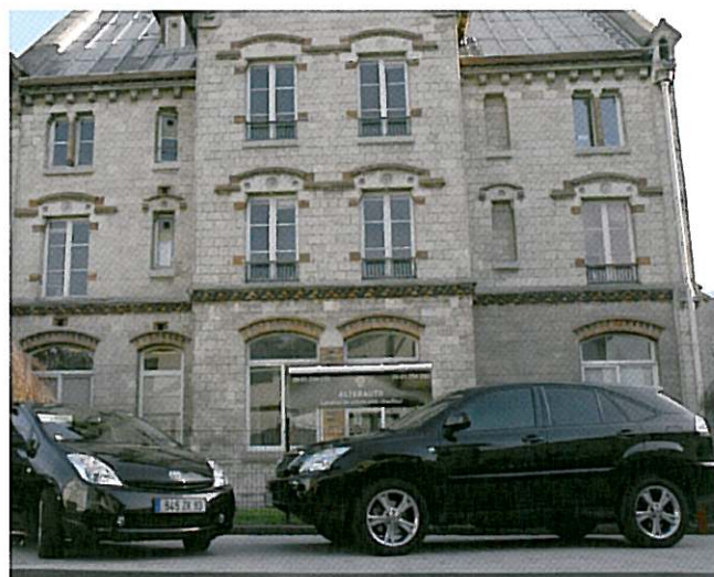
AlterAuto propose pour sa part des Lexus et Prius, des véhicules hybrides pour couvrir de grandes distances

che, dont les véhicules aient les routes du sud de ros Volants , celles de Roues sous un Para- paris comme nom la pre- cahier des charges de la Moins un véhicule qu'une vie », avec sa conduite vitesse limitée, son toit cette voiture populaire n'en achetée, démontée, entière. Sa production s'est out des années 80 mais tés ont repris le flambeau n des pièces détachées. Si