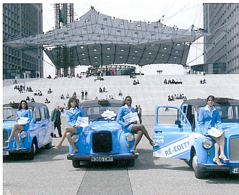
Cab Event propose différentes versions du célèbre taxi londonien, personnalisables si besoin

les trois sociétés sont plus habituées à réaliser des rallyes et autres chasses aux trésors, elles louent sans souci leur flotte. Pour les séminaires/congrès, avec assistance technique et voiture de remplacement, Escapa'Deuche, par exemple, demande 390 € la journée par 2CV. Outre ce fleuron de Citroën, À Vos Volants à La Baule Pornichet prévoit d'élargir son horizon courant 2010 « avec d'autres véhicules des années 50, simples à conduire, et dont les pièces détachées se trouvent encore facilement, parmi les-