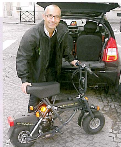
Après avoir rattaché les invités dans leur véhicule, les chauffeurs rentrent en scooter électriques pliables

Si Back and Safe dispose de plusieurs activités, dont un service voiturier, un service transport des personnes via minibus, monospaces, berlines ou autocars, son originalité réside dans son activité première, le rattachement des personnes ayant dépassé le taux d'alcoolémie autorisé. « Nous intervenons dans les 3 à 4 dernières heures de l'événement. Une hôtesse fait souffler tous les invités véhiculés – grosso modo 10 % – dans un éthylotest électronique »; ce qui permet d'en rassurer certains et surtout de repérer les autres, ceux qui sont positifs. Les chauffeurs de Back and Safe prennent alors leur place au volant, après avoir soigneusement glissé un scooter électrique pliable dans le coffre de la voiture... pour leur retour sur le lieu de la manifestation, pour prendre en charge d'autres chauffeurs fatigués. Ce service est valable dans un rayon de 15/20 km autour de la manifestation. De 20 à 40 km, les chauffeurs rattachent les invités... et sont ramenés par une voiture relais. Back and Safe demande entre 3 et 13 € par personne présente à l'événement, un tarif inversement proportionnel au nombre,